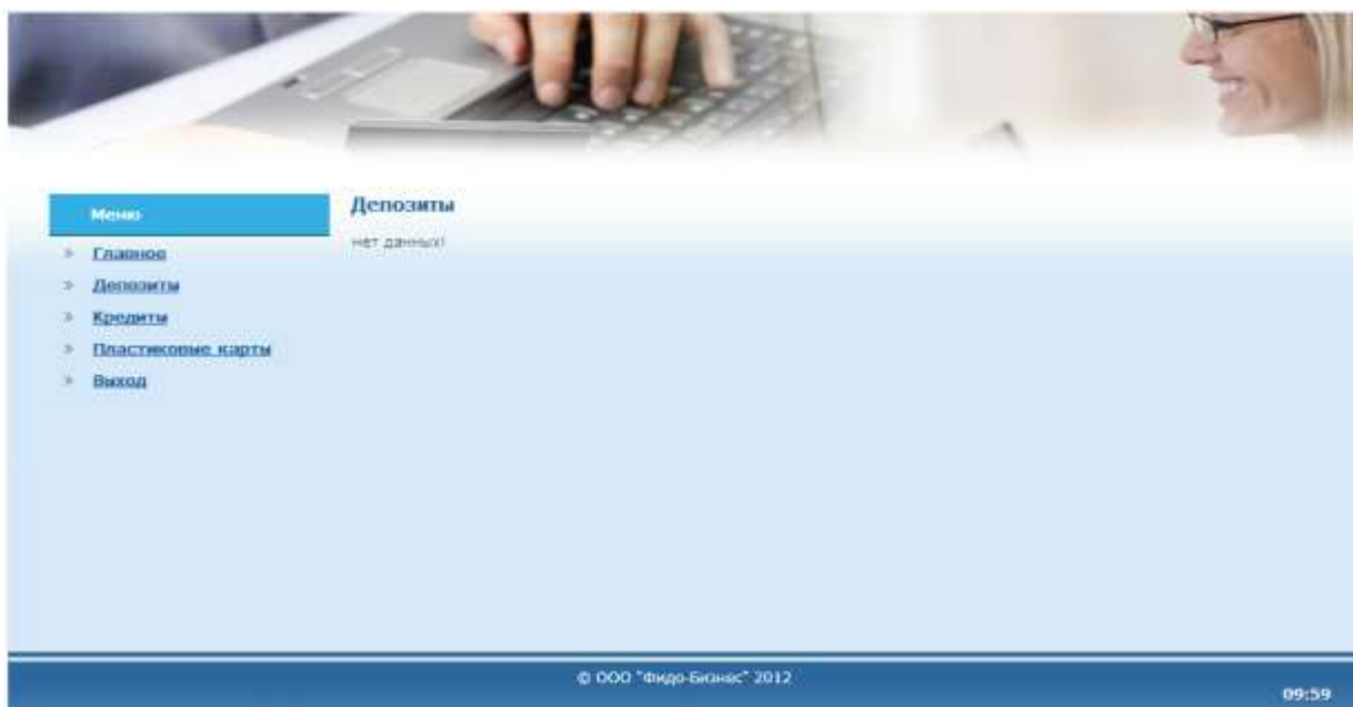
Рис. 8. Депозиты (юридического лица).

процентная ставка, остаток депозита, а также начисленные проценты и выплаченные проценты по депозиту.