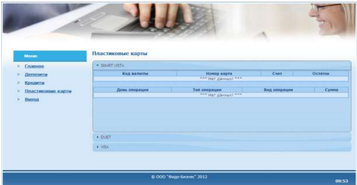
Рис. 5. Данные SMART VISTA (физического лица).