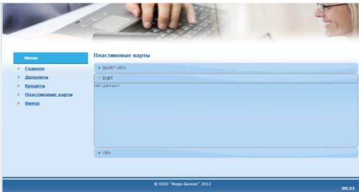
Рис. 11. Данные по корпоративной пластиковой карте DUET (юридического лица).