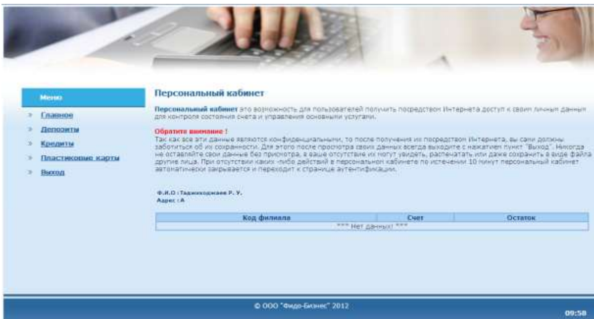
Рис. 2. Главное.

Работа в персональном кабинете после авторизации пользователя начинается с меню « Главное ». Здесь представлена основная информация о пользователе ( физическое лицо ): Фамилия Имя Отчество; Адрес; код филиала, в котором пользователь обслуживается, а также 20-значный счет и имеющийся остаток на данном счете.