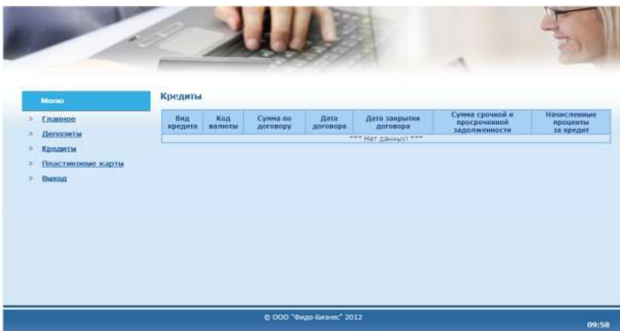
Рис. 9. Кредиты (юридического лица).

В пункте меню «Кредиты» предоставлена вся необходимая информация по кредитам, если таковые у организации имеются: вид кредита, валютный или сумовой (код валюты), сумма и сроки договора, дата закрытия договора, а также суммы срочной и просроченной задолженности и начисленные проценты за кредит.