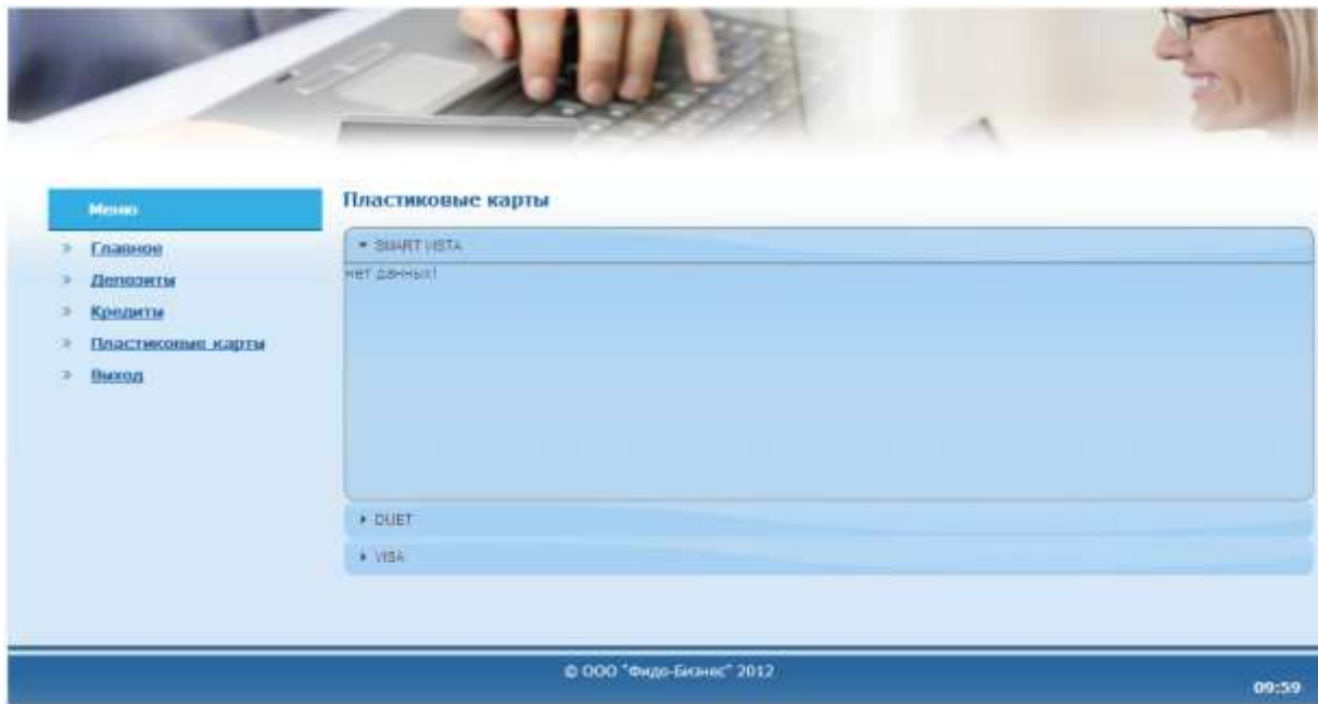
Рис. 10. Данные SMART VISTA корпоративной карточки (юридического лица).