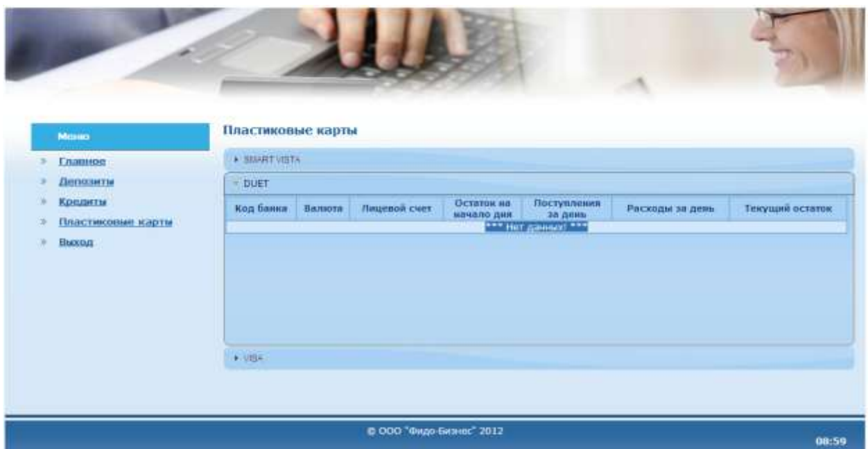
Рис. 6. Данные по пластиковым картам DUET (физического лица).