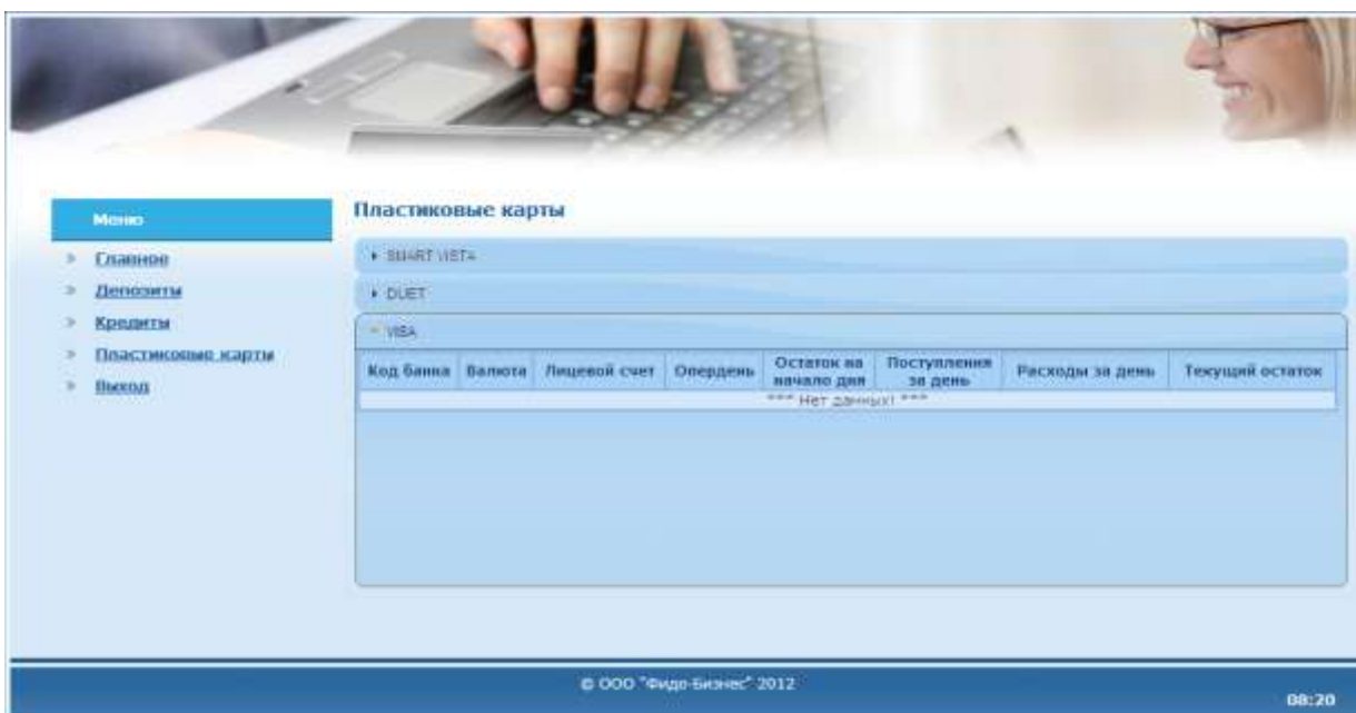
Рис. 7. Данные по пластиковым картам VISA (физического лица).